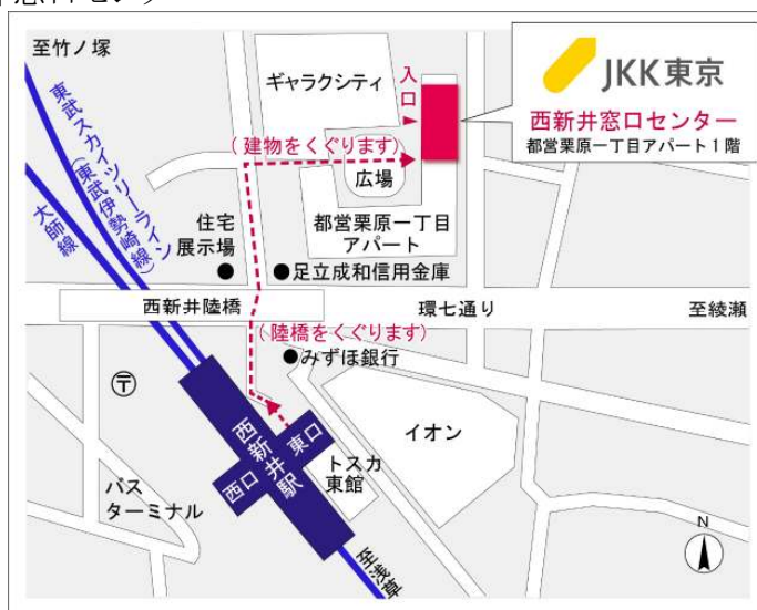
西新井窓口センター