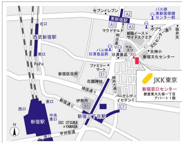
新宿窓口センター