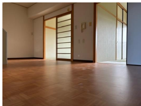
ゆったりとしたダイニング♪