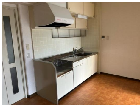
広々としたキッチン♪