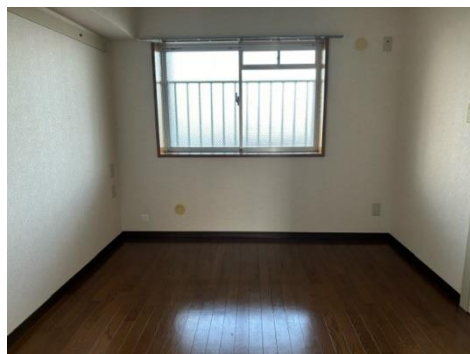
寝室にぴったりの洋室♪