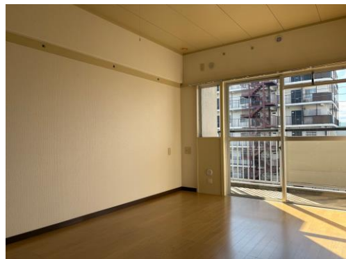
寝室にぴったりの洋室♪