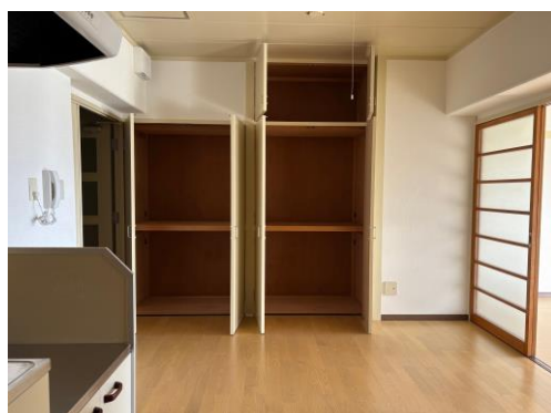
落ち着いた雰囲気のと室♪