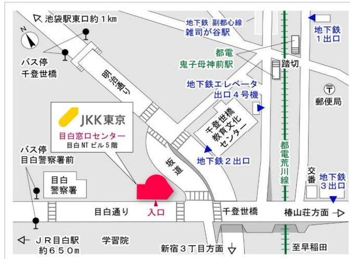
目白窓口センター