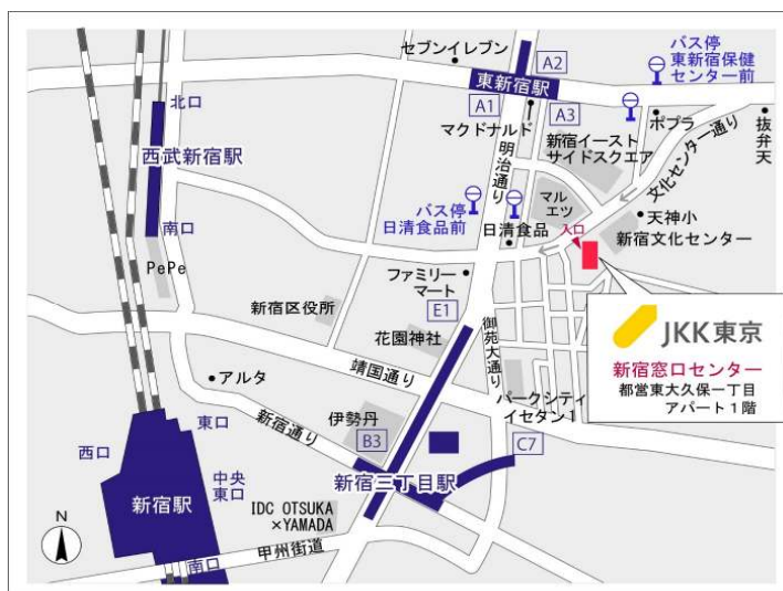
新宿窓口センター