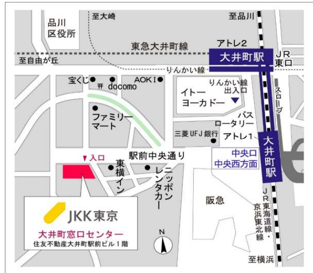
大井町窓口センター