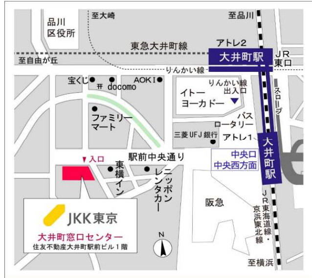
大井町窓口センター