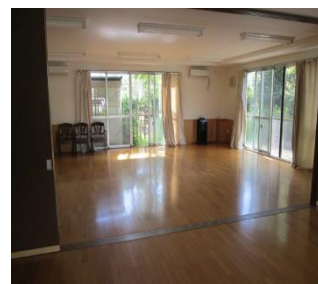
<都営住宅集会所内イメージ>

電子メール申請(minnadesalon@to-kousya.or.jp)及び郵送申請