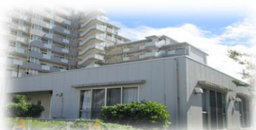
都営住宅の集会所