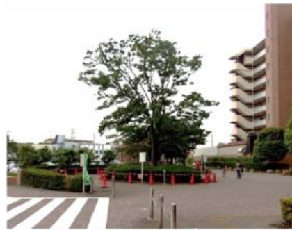
(参考) 南方向から見た広場