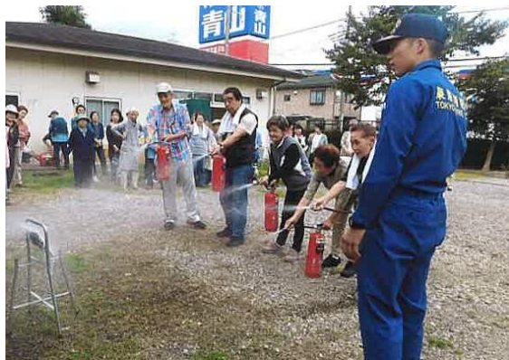
平成 29 年 10 月 8 日 八王子大和田町アパート (棟数 8、入居戸数 407)