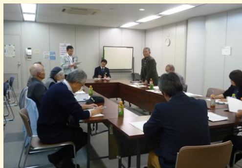
平成 29 年 10 月 20 日 懇談会の様子