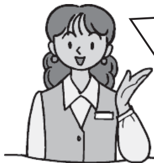
JKK 東京 お客さまセンター