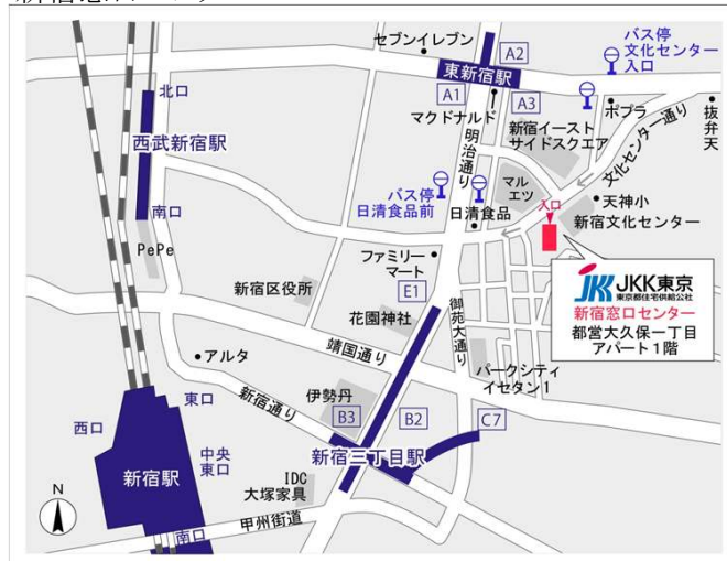
新宿窓口センター