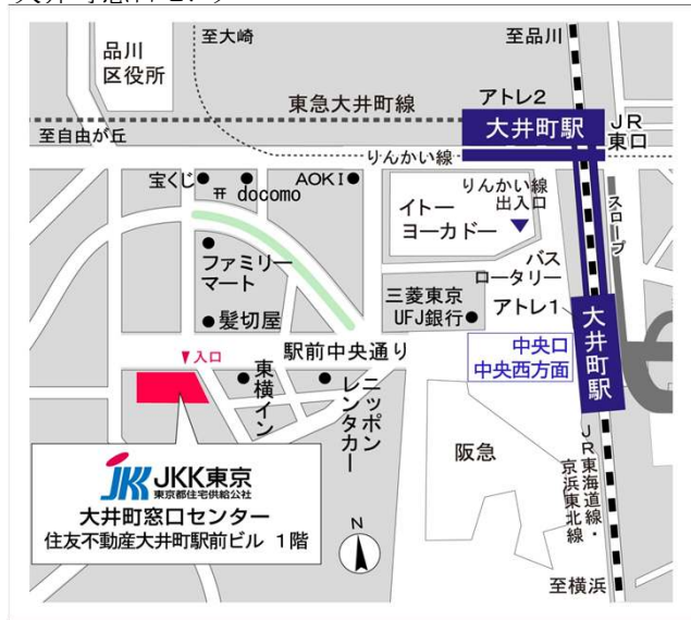
大井町窓口センター