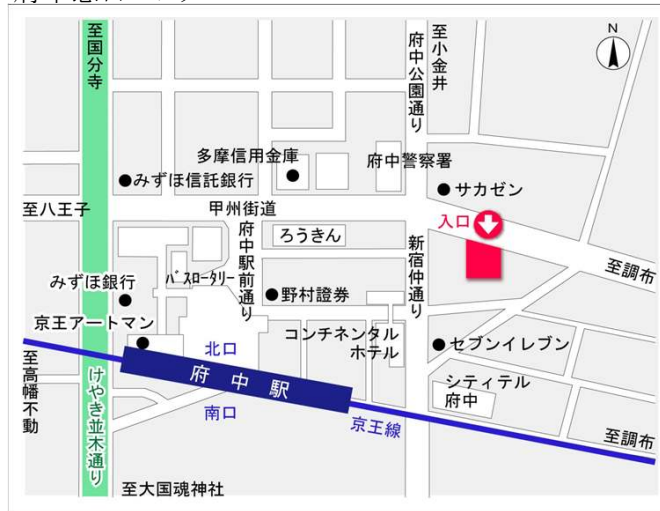
府中窓口センター