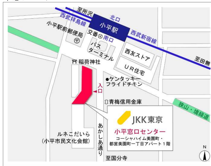
小平窓口センター