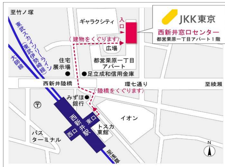
西新井窓口センター