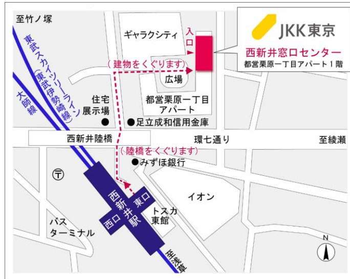
西新井窓口センター