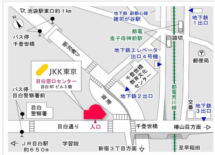
目白窓口センター