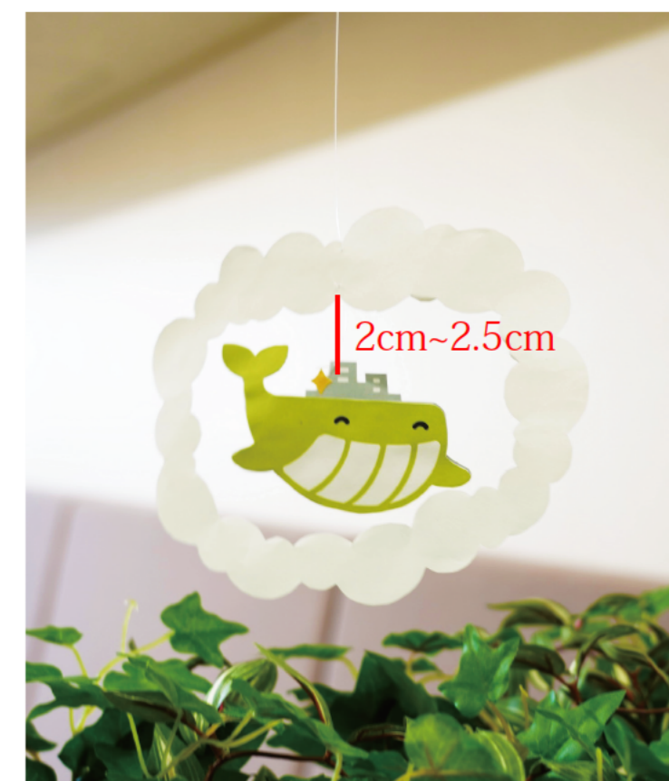
ユトジラと雲の間の糸の長さ 2cm～2.5cm程度