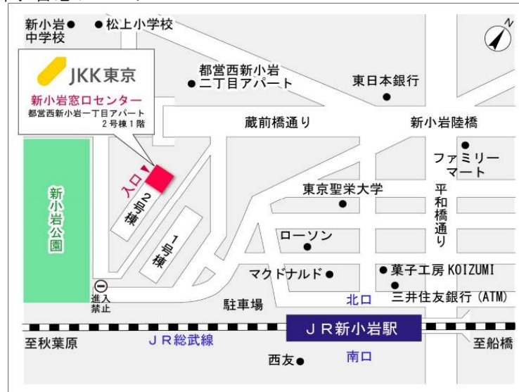
新小岩窓口センター