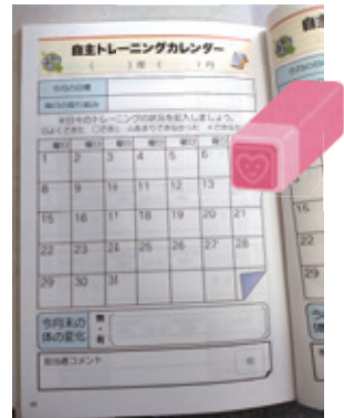
参加活动时，可以在健康训练日历上盖参加印章。

在地域上的社会福祉协议会（和之家 桑川）的帮助下，每个月两次（第二和第四个周四）请来在江户川区内活跃的预防衰弱体操的讲师，组织大家做伸展活动和脑部活跃训练。