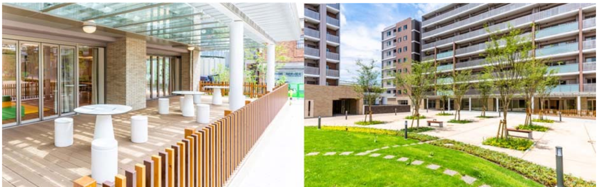
上) 2期街区広場よりコーシャハイム向原