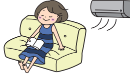
② 에어컨 사용