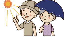
③ 외출 시에는 모자·양산