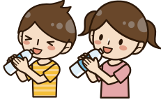
① 자주 수분을 보충

9월에 접어들었습니다만, 아직 열중증의 위험은 높으며 방심할 수 없습니다. 기온·습도가 높은 날이나 갑자기 기온이 상승한 날에는 열중증에 걸릴 위험이 있습니다. 다음 대책을 참고로 예방 행동을 취합시다.