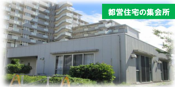
都営住宅の集会所

に都営住宅の 集会所を活用してみませんか？ 公社が主催者と自治会との橋渡し を行います！