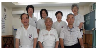
竹の塚六丁目アパート2号棟 自治会のみなさまと体操の先生方