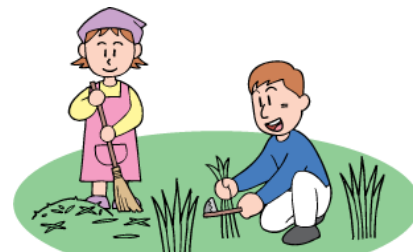
草刈り、中低木の刈込・剪定